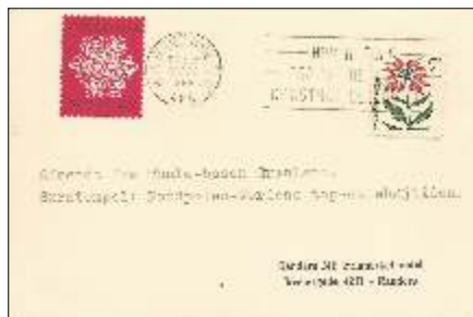
Fortrykt adresse på kort fra 1966.