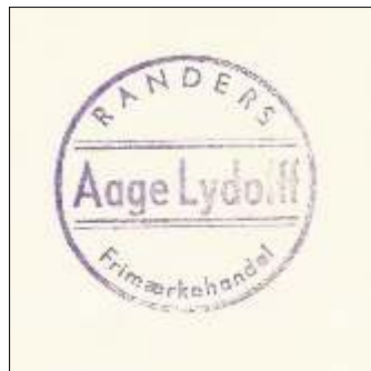
Firmastempel fra Randers Frimærkehandel ved Aage Lydloff.