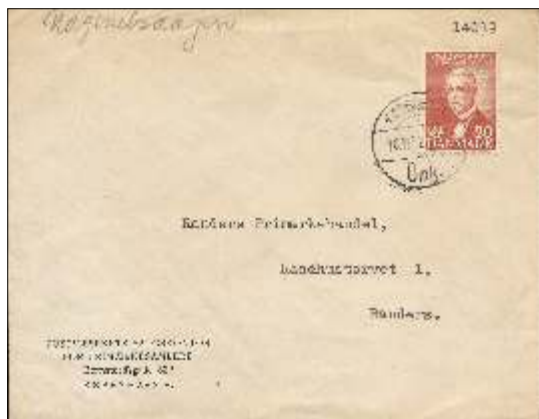
Førstedagskuvert fra Post-væsenets Salgskontor