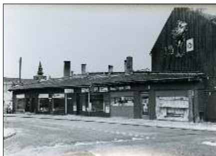
Svend's Frimærker i Store Voldgade 3.