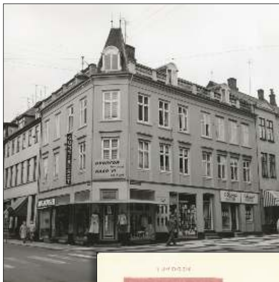
Vester Kirkestræde 14