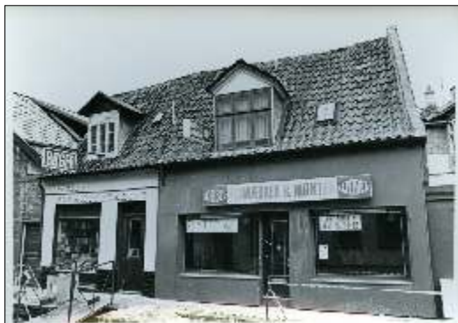
Weibel Frimærker i Lille Voldgade 2.