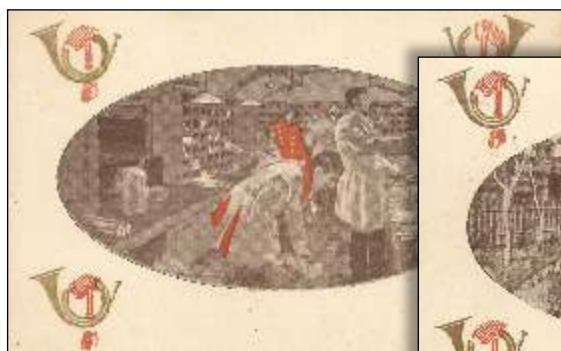
Kl. 12 nat. I bureauet i natekspresen.