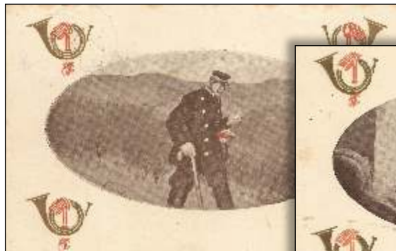
Kl. 9 formiddag. Med landpostbuddet på heden.