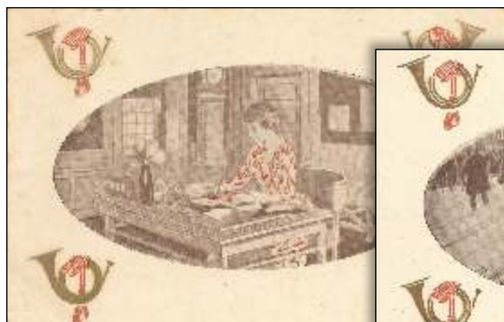
Kl. 6 aften i København. Brevet skrives.