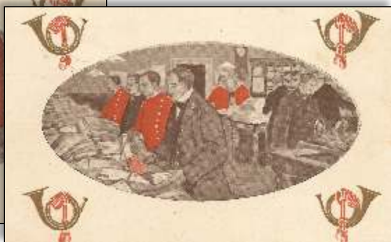
Kl. 7 aften. På afgangsposthuset.