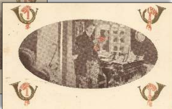
Kl. 10 formiddag. Brevet er ankommet til plantøren i statsplantagen.

Brevet er således afleveret under et døgn efter, at det er sendt.