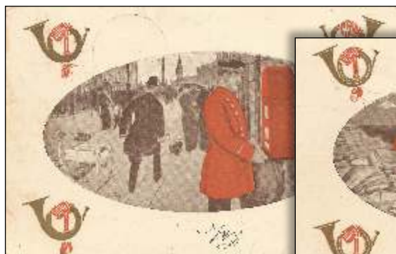
Kl. 6¾ aften. Brevkassen tømmes.