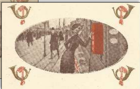
Kl. 6½ aften. Brevet lægges i postkassen på Rådhuspladsen.