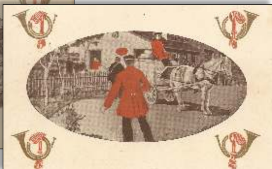
Kl. 5 morgen. Ankomsten til Vestjylland.